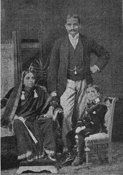
माता पिता और परिडित जवाहर लाल